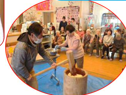
みんなで息を合わせて餅つき。応援ももらって力が入ります。