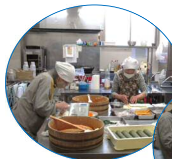
お弁当づくりには、前日の仕込みも含めて、延べ13名の方にご協力いただき、美味しいお弁当ができました。

2月21日の会食会では、お弁当づくりや演芸など、たくさんのボランティアさんにご協力いただきました。みなさんのおかげで、盛大に開催することができました。