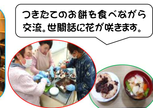
つきたてのお餅を食べながら交流。世間話に花が咲きます。