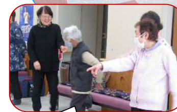
ボールをどこに投げるか、みんなで話し合いながら挑戦します。