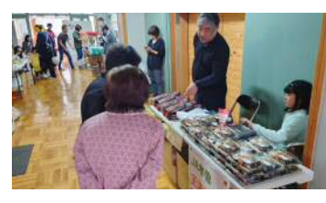
昨年の会場の様子