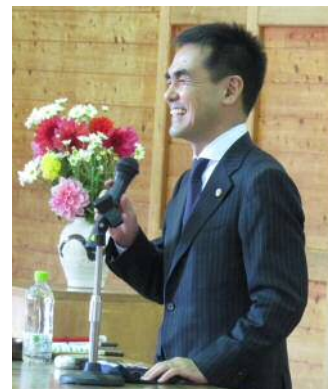
大胡田さんの講演の様子