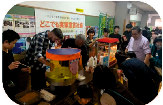
ふれあい交流 ～ミニこども祭り～